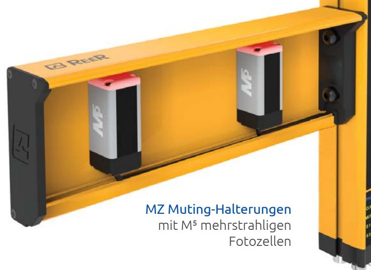
MZ Muting-Halterungen mit M 5 mehrstrahligen Fotozellen